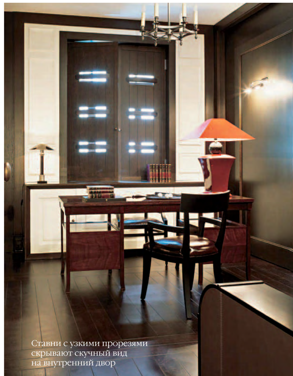
Ставни с узкими прорезями скрывают скучный вид на внутренний двор