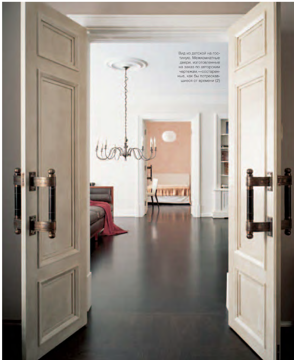
Вид из детской на гостиную. Межкомнатные двери, изготовленные на заказ по авторским чертежам, — состаренные, как бы потрескавшиеся от времени (2)