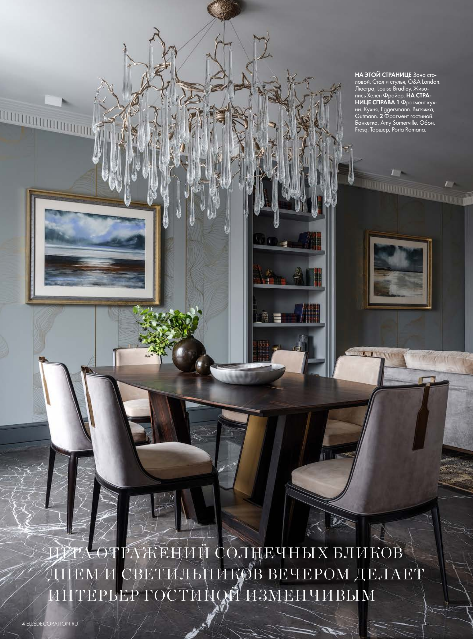
НА ЭТОЙ СТРАНИЦЕ Зона столовой. Стол и стулья, O&A London. Люстра, Louise Bradley. Живопись Хелен Фрайер. НА СТРАНИЦЕ СПРАВА 1 Фрагмент кухни. Кухня, Eggersmann. Вытяжка, Gutmann. 2 Фрагмент гостиной. Банкетка, Amy Somerville. Обои, Fresq. Торшер, Porta Romana.

ИГРА ОТРАЖЕНИЙ СОЛНЕЧНЫХ БЛИКОВ ДНЕМ И СВЕТИЛЬНИКОВ ВЕЧЕРОМ ДЕЛАЕТ ИНТЕРЬЕР ГОСТИНОЙ ИЗМЕНЧИВЫМ