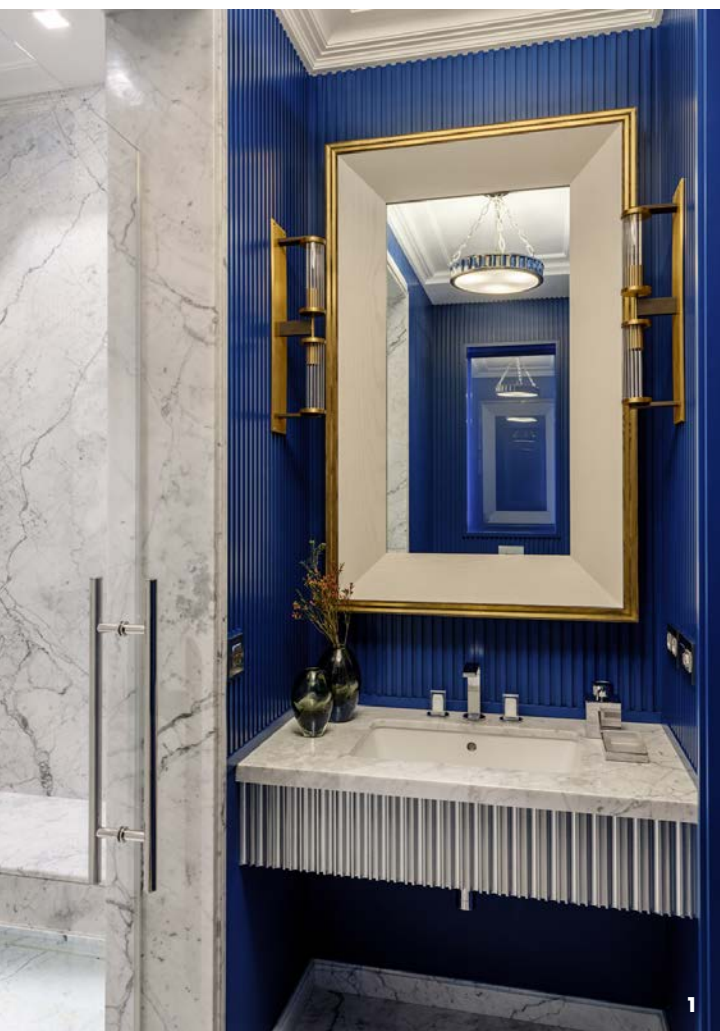
НА ЭТОЙ СТРАНИЦЕ 1 Ванная комната. Зеркало, Birgit Israel. Бра, Jonathan Browning Studios. Люстра, Hudson Valley. 2 Мебель в гардеробной выполнена по чертежам Олега Клодта. 3 Фрагмент спальни. Люстра, Tigermoth. Бра, Porta Romana. Стол, Louise Bradley. Кресло, The Odd Chair Company. НА СТРАНИЦЕ СПРАВА Фрагмент спальни. Подвесные светильники, Avrett. Кровать, Bellavista. Тумбочка, Julian Chichester.